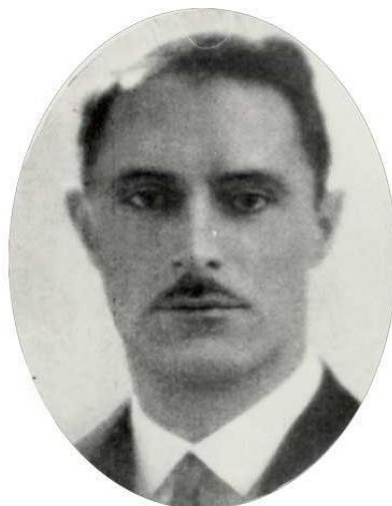
А. Н. Круглевский

Александр Николаевич Круглевский (27.05.1886 – 13.12.1964) в 1908 году окончил юридический факультет Санкт-Петербургского университета и в 1914-м, после стажировки в Германии (в Берлине и Мюнхене), был принят в число приват-доцентов Санкт-Петербургского университета. В связи с открытием в 1916 году Пермского отделения Петроградского университета А. Н. Круглевский был командирован в Пермь для чтения лекций по истории русского права 1 , а 1 июля 1917 года назначен исполняющим обязанности ординарного профессора Пермского университета. Во время пребывания в ПГУ читал курсы «История русского права», «Наука о преступлении и наказании», «История русской культуры», «Введение в социологию», а также курс «Сельскохозяйственная кооперация» — на агрономическом факультете. После нескольких лет работы в Томском