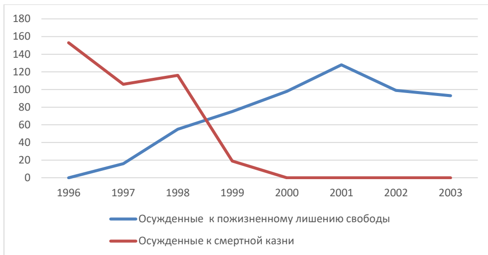
Диаграмма 1. Осуждение к лишению свободы пожизненно и смертной казни (1996–2003) 6

Начиная с 2004 года ПЛС становится в полной мере самостоятельным наказанием, так как из текста статьи 57 УК РФ устранено указание на него как на альтернативу смертной казни. Теперь это наказание может быть назначено и в тех случаях, когда санкция статьи УК РФ с описанием конкретного состава преступления не содержит наказания в виде смертной казни 7 .